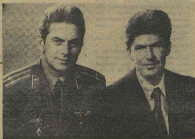
На снимке: космонавты В. В. Ковалёнок и В. В. Рязин (справа).