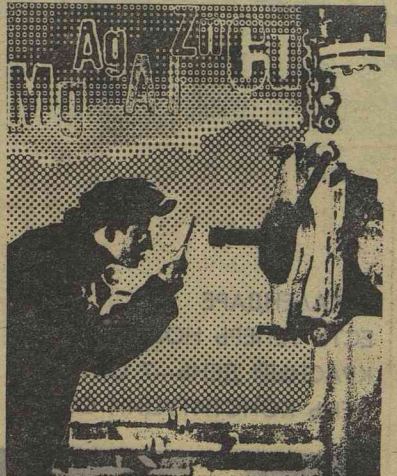
Рис. Г. МАЛОФЕЕВА

приски. Обычно делать это бывает очень трудно. Другим ни жить, ни работать. Месторождения зачастую находятся в самых отдалённых и труднодоступных районах страны. Например, Чукотку и Таймыр, Якутию и Колыму, можно сказать, открыли металлурги. Отсюда наша страна получает золото, вольфрам, олово, вольфрам, сурьму, ртуть.